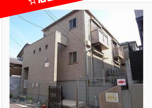
総タイル貼の外観

京浜東北線大井町駅徒歩6分 東急大井町線大井町駅徒歩7分 りんかい線大井町駅徒歩7分