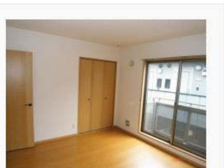
日当たりの良い室内