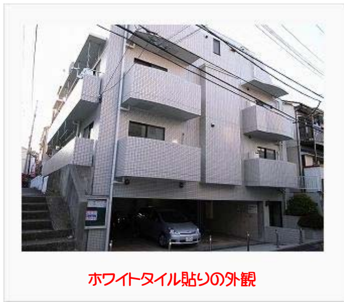
ホワイトタイル貼りの外観